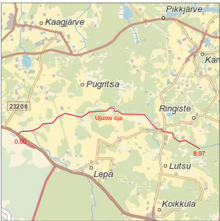
Kaardilieded: 541 Valga; 443 Hargla